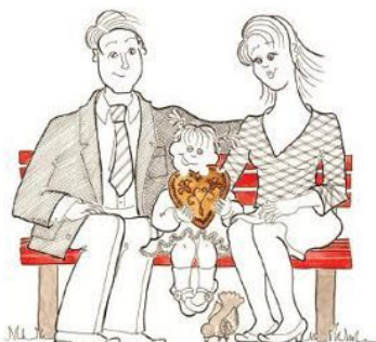
oni sedijo they are sitting