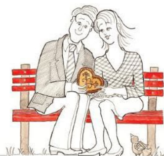
onadva sedita they are sitting