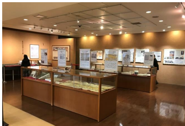
(写真)平成 29 年度連携企画展

また平成 29 年度の連携企画展では、企画展を通じて、行政文書の保存の重要性を考えてもらいたいと願い、「行政文書とは?」というコーナーを設け、行政文書の役割や種類、保存の意義について紹介しました。今後も連携企画展では、単なる歴史紹介に留まらない企画展のあり方を協働して模索していく予定です。