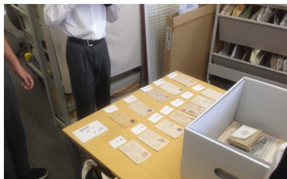
(写真)平成 29 年度府中市職場体験

本件につきましては簡易報告書を文書館のホームページに掲載しております。御参照下さい。