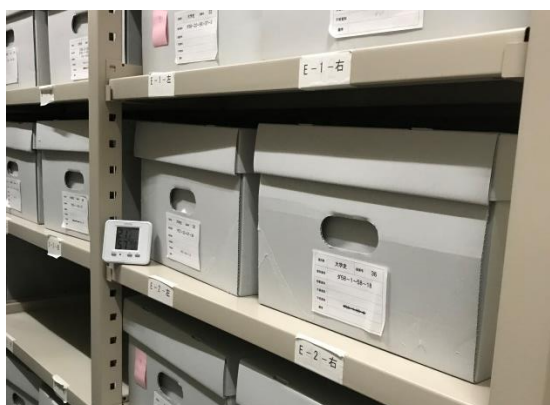
(写真)第 1 収蔵庫

そこで大学文書館では、長期的視野に立った保存計画を検討するため、平成 29 年度保存環境の現状と課題を調査・整理するとともに、保存プログラム案の整備に着手しました。以下、保存環境の現状と課題を紹介します。